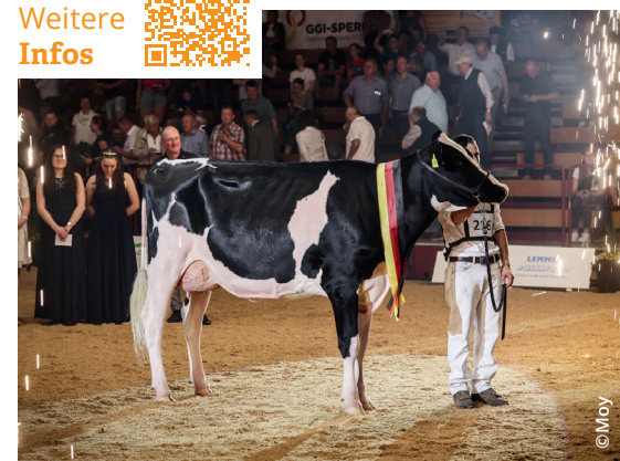
Junior Supreme Champion Loh Milana (Lambda x O Ki) vom Betrieb Lohmöller