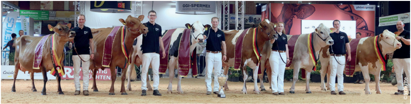
Bundessieger aller sechs Rassen mit zwei und mehr Kalbungen